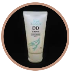
Presentación de 50 g

Humectante | Protector Solar | Toque de color | Antiedad