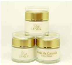
Presentación de 50 g

Además contiene colágeno, elastina, antioxidantes, proteínas, vitaminas y enzimas.