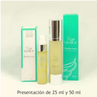
Presentación de 25 ml y 50 ml

Suaviza y disminuye notablemente la apariencia de las arrugas en 10 minutos .