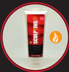
Presentación de 100 g

Se ajustan perfectamente a cada cuerpo gracias a sus tres bandas de compresión (bajo busto, bajo vientre y cintura). Las fajas Lisara son UNISEX y están hechas con materiales de alta calidad que garantizan una máxima durabilidad.